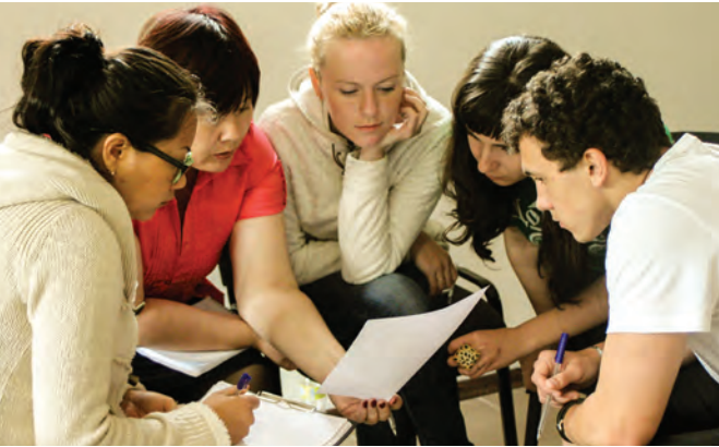
Teilnehmer_innen in der Diskussion über die Wirksamkeit von Werkzeugen im Kampf gegen Rechtspopulismus